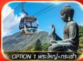
OPTION 1 พระใหญ่+กรงเจ้า