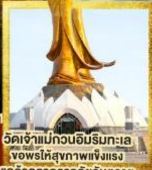
วัดเจ้าแม่กวนอิมริมทะเล ขอพรให้สุขภาพแข็งแรง แคล้วคลาดจากภัยอันตราย

เดินทาง 27-30 มี.ค. 68 05-08, 10-13 เม.ย. 68 24-27, 26-29 เม.ย. 68 02-05, 03-06 พ.ค. 68