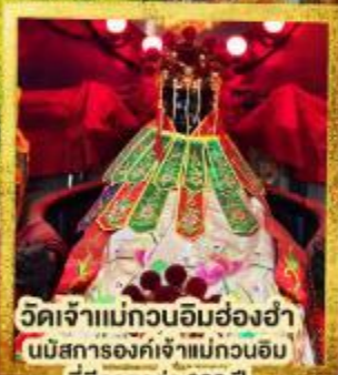
วัดเจ้าแม่กวนอิมฮ่องกง นมัสการองค์เจ้าแม่กวนอิม ที่มีอายุกว่า 600 ปี

★★★★ พัก 4 ดาวทุกคืน ย่านช้อปปิ้งจิมซาจуй