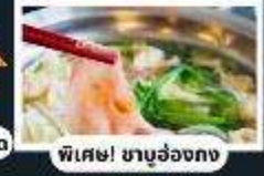
พิเศษ! ชาบูฮ่องกง

พักรูในดิสนีย์แลนด์ 1 คืน พร้อมบัตรเครื่องเล่นแบบจุใจ