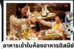
อาหารเข้าในห้องพักอาหารดิสนีย์