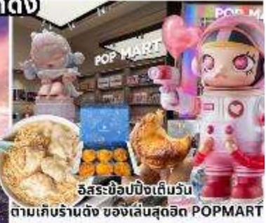
อิสระช้อปปิ้งเต็มวัน ตามเคาน์เตอร์ดัง ของเล่นสุดฮิต POPMART