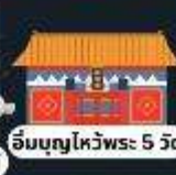
อิมบุงกุไหว้พระ: 5 วัด