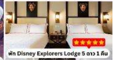
พนัก Disney Explorers Lodge 5 ดาว 1 คืน