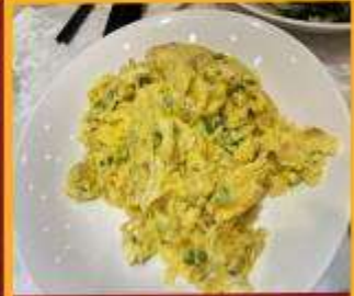
ไข่เจียวทรงเครื่อง