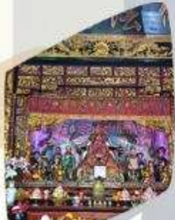
วัดซ่งเจียง+เทพนาคา