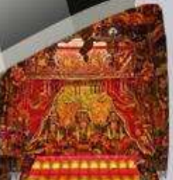
เจ้าแม่ทับทิม Joss House Bay