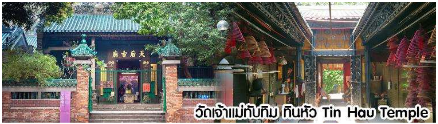
วัดเจ้าแม่ทับทิม ทินฮิว Tin Hau Temple

นำท่านเที่ยวเกาะฮ่องกง หนึ่งในแหล่งท่องเที่ยวยอดนิยมหาดทราย Repulse Bay หาดทรายรูปจันทร์เสี้ยวแห่งนี้สวยที่สุดแห่งหนึ่ง และยังใช้เป็นฉากในการถ่ายทำภาพยนตร์ไปหลายเรื่องมีรูปปั้นของเจ้าแม่กวนอิม และเจ้าแม่ทินฮิวซึ่งทำหน้าที่ปกป้องคุ้มครองชาวประมง โดดเด่นอยู่ท่ามกลางสวนสวยที่ทอดยาวลงสู่ชายหาด ให้ท่านนมัสการขอพรจาก เจ้าแม่กวนอิม และเทพเจ้าแห่งโชคลาภเพื่อเป็นสิริมงคล ชำระสะพานต่ออายุซึ่งเชื่อกันว่าข้ามหนึ่งครั้งจะมีอายุเพิ่มขึ้น 3 ปี จนกว่าถึงเวลานัด