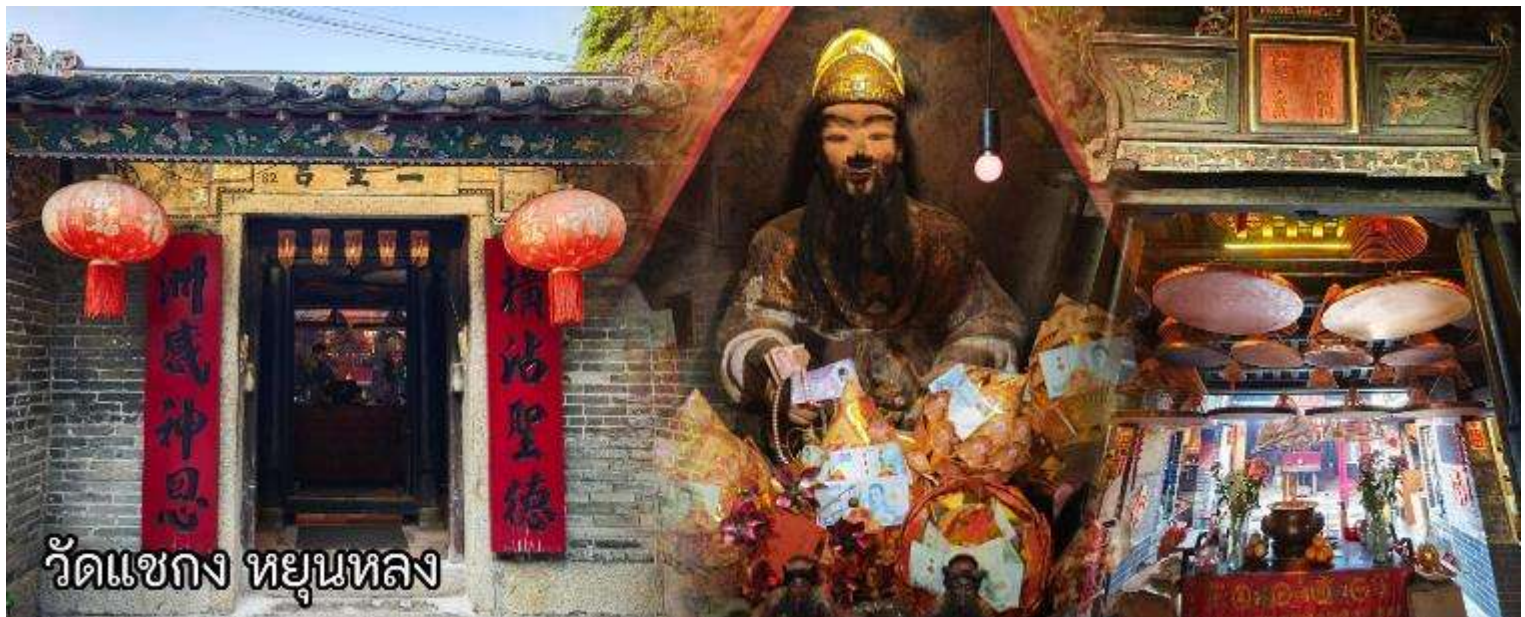
วัดแซกง หยุนหลง

หลังจากนั้นเดินทางสู่เขตหยุนหลง ซึ่งเป็นที่ตั้งขององค์แซกงองค์ดั้งเดิมกว่า 600 ปี I Shing Temple ซึ่งในมือถือขวานเป็นอาวุธ