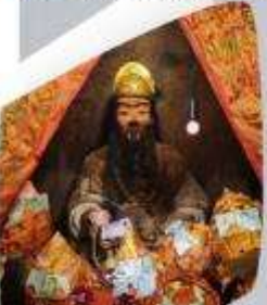
แซ่กงนงนาค