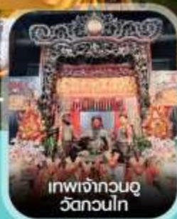
เทพเจ้ากวนอู วัดกวนไท่

✈ คอนเฟิร์ม ออกเดินทาง ทุกพีเรียด 2 ท่านขึ้นไป ✈