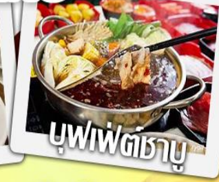
บุฟฟัตธาบู