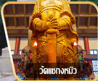
วัดเขangkงหวี