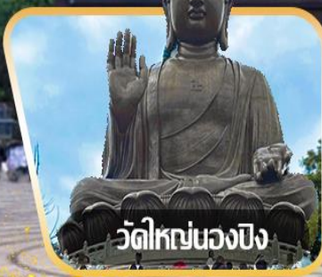
วัดใหญ่หนองปิง