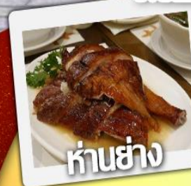
ก๋านย่าง