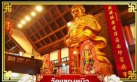
วัดแซงทิว