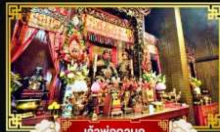
เจ้าพ่อกวนอู