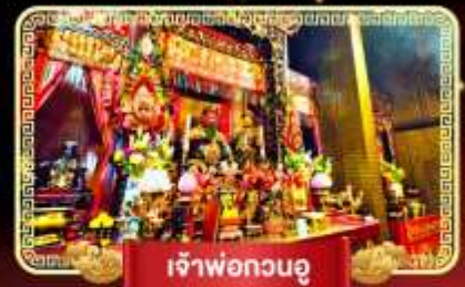
เจ้าพ่อกวนอู