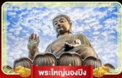
พระใหญ่นองปิง

ฟรีเปิดทองพระคลังเจ้าแม่กวนอิม บินลัดฟ้าไปบูชาเกาะฮ่องกง