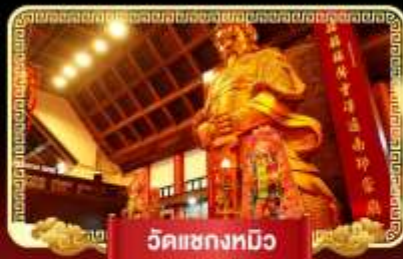
วัดเขangkหมิว