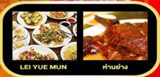
LEI YUE MUN