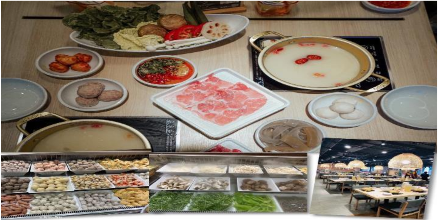
เที่ยง รับประทานอาหารเที่ยง ณ ภัตตาคาร (5) เมนูชาบู