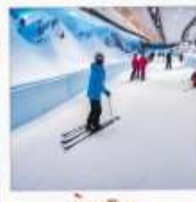
บ้านหิมะ WINDOW OF THE WORLD