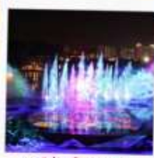
โชว์น้ำสามมิติ OCT BAY WATER SHOW