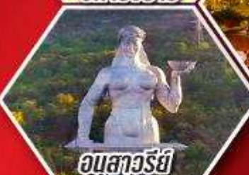
อนุสาวรีย์