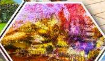
ด้าไฟรมีริอุส