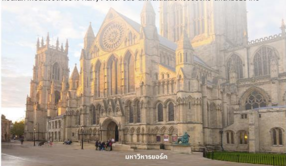
มหาวิหารยอร์ก

จากนั้นนำท่านเดินทางต่อไปที่ The Shambles (เดอะแชมเบิล) เป็นสถานที่ที่มีความคล้ายกับตรอกไดอากอนในภาพยนตร์ชื่อดังอย่าง Harry Potter อีสระให้ท่านเดินเลือกซื้อของที่ระลึกตามอัธยาศัย