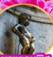
มานเคนพิส