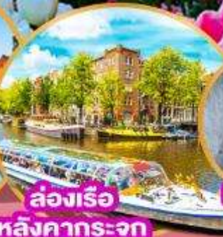
ล่องเรือ หลังคากระจก