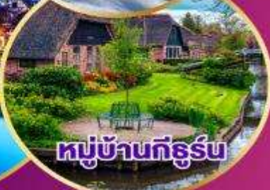
หมู่บ้านกีธูร์น