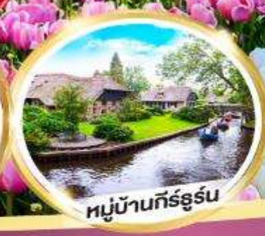
หมู่บ้านกีร์ธูร์น