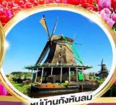
หมู่บ้านกังหันลม