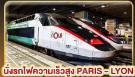
นั่งรถไฟความเร็วสูง PARIS - LYON