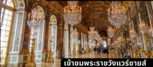
เข้าชมพระราชวังแวร์ซายส์