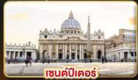
เซนต์ปีเตอร์