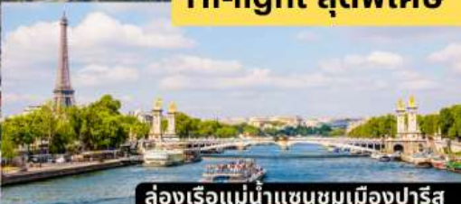
ล่องเรือแม่น้ำแซนชมเมืองปารีส