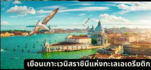
เยือนเกาะเวนิสราชมินแห่งทะเลเอเดรียติก

หอยแครงสด / / ฟองดูว์ 3 อย่าง / สเปกเก็ตตีหมึกดำ