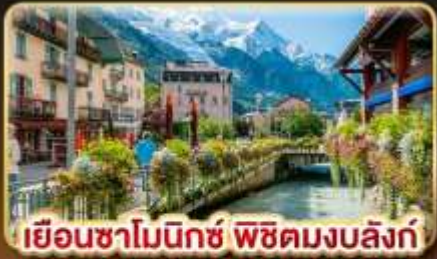
เยือนซาโมนิกซ์ พิชิตมงบลังก์