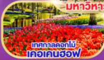
เทศกาลดอกไม้ เคอเคนฮอฟ