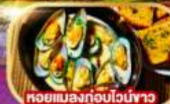
หอยแมลงภู่อบไวน์ขาว