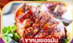
ชาหมูเยอรมัน

พิเศษ!! เมนูหอยแมลงภู่อบไวน์ขาวและชาหมูเยอรมัน