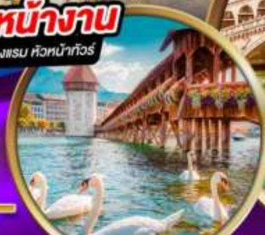
สะพานไม้ ซาเปลา