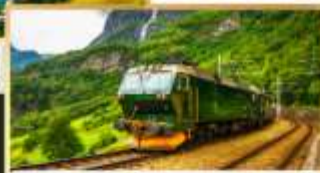
รถไฟสายฟลิมสบาน่า