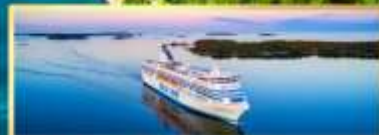
เรือ Tallink Silja Line