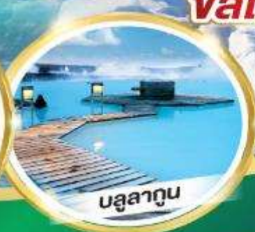
บรูสาอูน