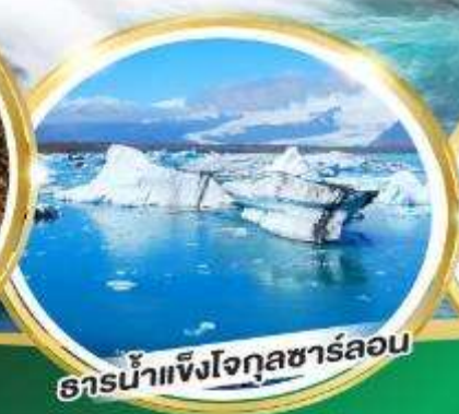
ธารน้ำแข็งโจกุลชาร์ลอน