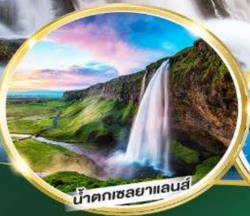
น้ำตกเซลยาแลนส์