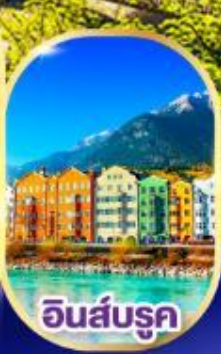
อินส์บรุค