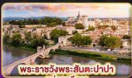
พระราชวังพระสันตะปาปา แห่งอเวญูง