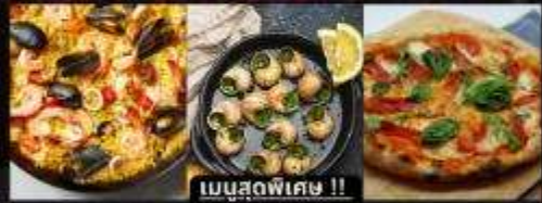
PAELLA ข้าวผัดสเปน / หอยแครงสด / พิซซ่ามากริตต้า