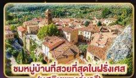
ชมหมู่บ้านที่สวยงามที่สุดในฝรั่งเศส (มูสติเยแซงก์มารี)