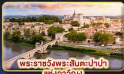
พระราชวังพระสันตะปาปา แห่งอเวัญง