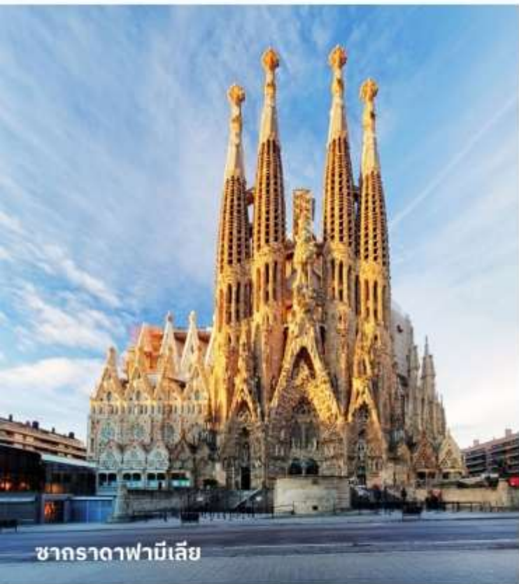
ซากرادาฟามีเลีย