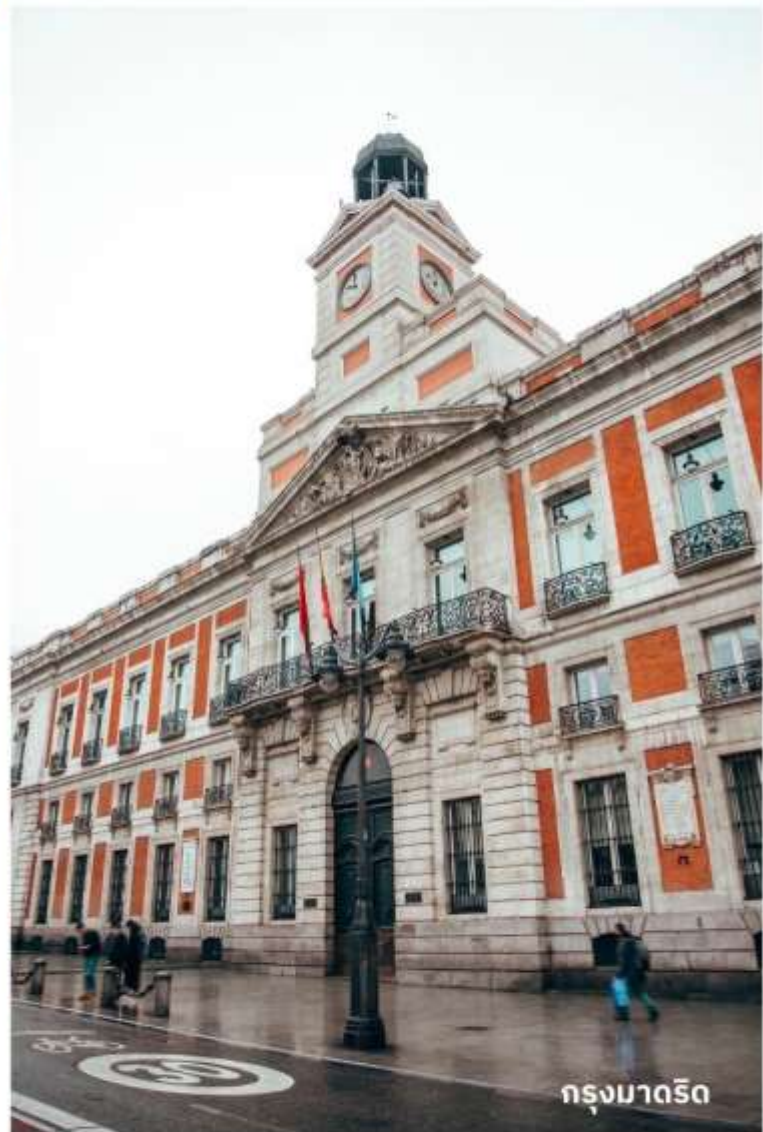
กรุงมาดริด