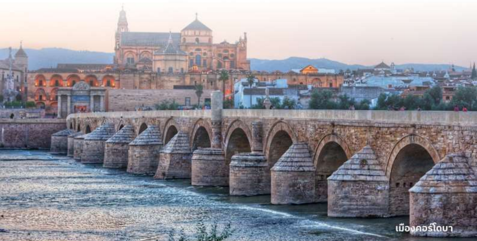
เมืองคอร์โดบา

บริการอาหารค่ำ ณ ภัตตาคาร นำท่านเข้าสู่ที่พัก Macia Alfaro หรือเทียบเท่า