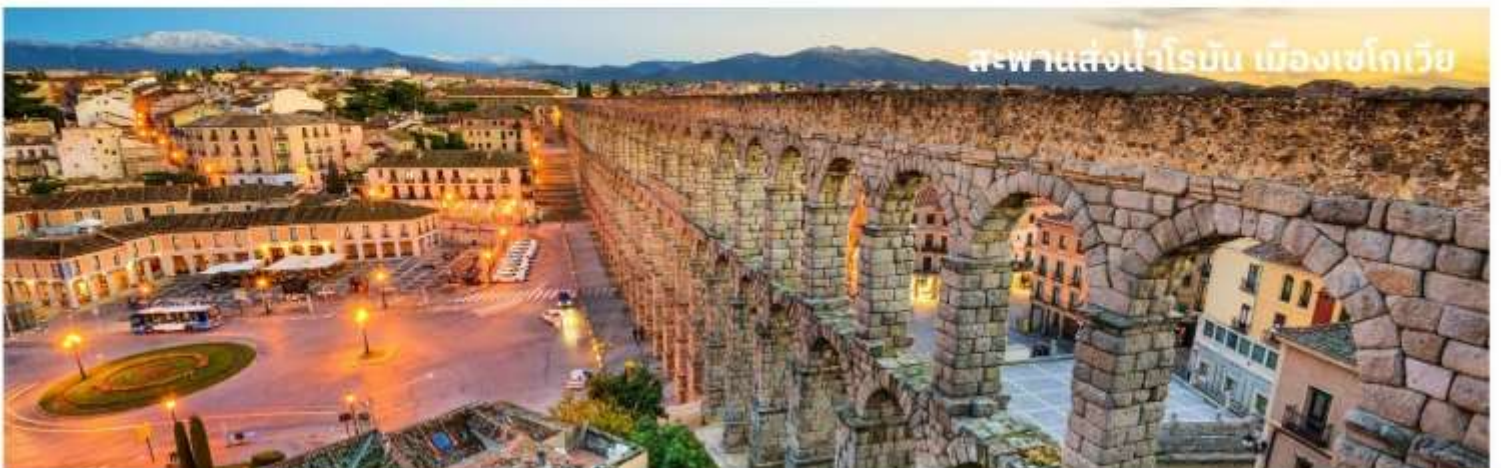
สะพานส่งน้ำโรมัน เมืองเซโกเวีย

ท่านสามารถทำการสแกน QR CODE นี้ เพื่อรับชมข้อมูลดังต่อไปนี้ สถานที่ท่องเที่ยวในเมืองเซโกเวีย (Segovia)