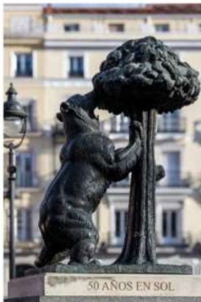
50 AÑOS EN SOL