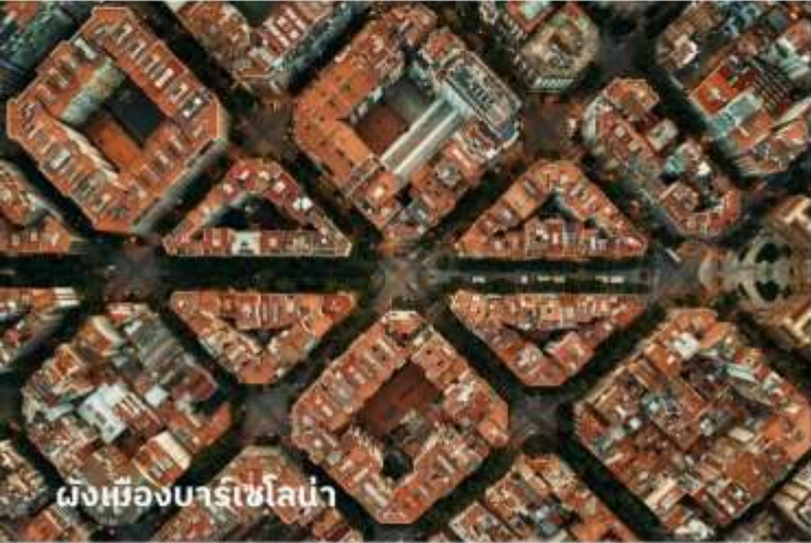
ผังเมืองบาร์เซโลน่า