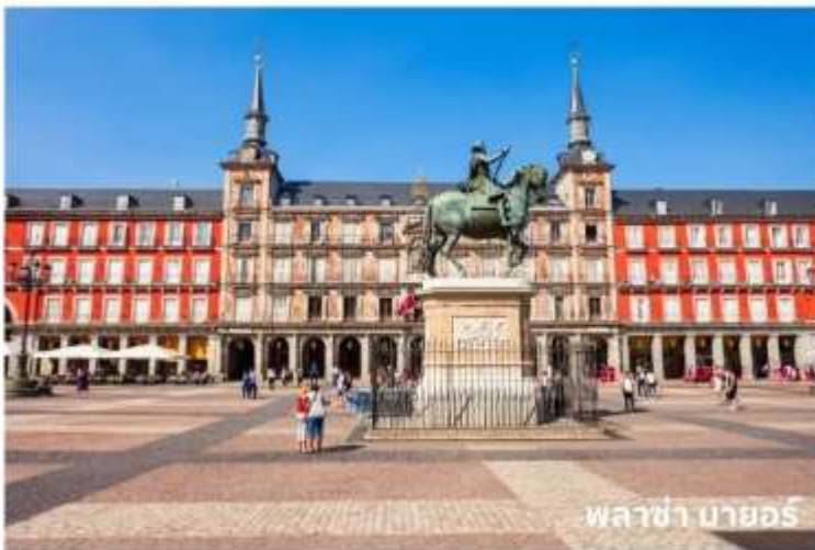
พลาซ่า มายอร์

จากนั้นนำท่านเดินทางสู่ กรุงมาดริด (Madrid) เมืองหลวงของประเทศสเปน ตั้งอยู่ใจกลางแหลมไอบีเรีย ในระดับความสูง 650 เมตร เป็นมหานครอันทันสมัยล้ำยุคที่กษัตริย์ฟิลลิปที่ 2 ได้ทรงย้ายที่ประทับจากเมืองโทเลโดมาที่นี้และประกาศให้มาดริดเป็นเมืองหลวงใหม่ ยกเว้นในช่วงประมาณปี ค.ศ. 1601-1607 เมื่อพระเจ้าฟิลลิปที่ 3 ได้ย้ายเมืองหลวงไปที่เมืองวัลลาโดลิด มาดริดได้ชื่อว่าเป็นเมืองหลวงที่สวยงามที่สุดแห่งหนึ่งในโลกและสูงสุดแห่งหนึ่งในยุโรป จากนั้นผ่านชม น้ำพุไซเบเลส (Cibeles Fountain) ที่สร้างอุทิศให้แก่เทพธิดาไซเบลิน เป็นสถานที่ที่ใช้ในการเฉลิมฉลองในเทศกาลต่างๆของเมือง และนำท่านเดินทางสู่ พลาซ่า มายอร์ (Plaza Mayor) ใกล้เคียง เขตปูเอตาเดลซอล หรือประตูพระอาทิตย์ ซึ่งเป็นจุดศูนย์กลางเมือง นับเป็นจุดนัดภักโกลเมตรแรกของสเปน (กิโลเมตรที่ศูนย์) และยังเป็นศูนย์กลางรถไฟใต้ดินและรถเมล์ทุกสาย นอกจากนี้ยังเป็นจุดตัดของถนนสายสำคัญของเมืองที่หนาแน่นด้วยร้านค้าและห้างสรรพสินค้าใหญ่มากมาย