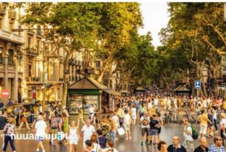
ถนนลารัมบลลา