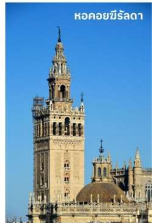
หอคอยฆีรัลดา

หลังจากนั้นนำท่านเดินทางสู่ เมืองคอร์โดบา (Cordoba) ใช้เวลาเดินทางประมาณ 2 ชั่วโมง ครั้งหนึ่งเคยถูกครอบครองโดยชาวโรมันและชาวมัวร์จากอาหรับ เมืองคอร์โดบาตั้งอยู่ริมฝั่งแม่น้ำกัวดาลกีเบีย เป็นเมืองศูนย์กลางของวัฒนธรรมมุสลิมในประเทศสเปน องค์การยูเนสโกได้ประกาศให้เมืองคอร์โดบาเป็นเมืองมรดกโลกของประเทศสเปน เมืองนี้เป็นเมืองในระบบกาหลิบที่มีความเจริญรุ่งเรืองที่สุดของยุโรปในสมัยศตวรรษที่ 10 มีการสร้างมหาวิทยาลัยเน้นการเรียนรู้ด้านวรรณกรรม, วิทยาศาสตร์ ปรัชญาและการแพทย์