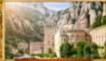
ซานอันโตนิโอ