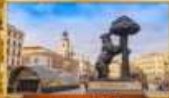
อนุสาวรีย์เปนี

เมนู พิเศษ! ข้าวผัดลูปเป + ทุยกับอิมเลียงชือ