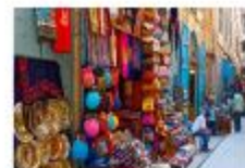
ตลาดขานเอลคาลลี

20.50 น. ออกเดินทางสู่อิสตันบูล เที่ยวบิน TK695