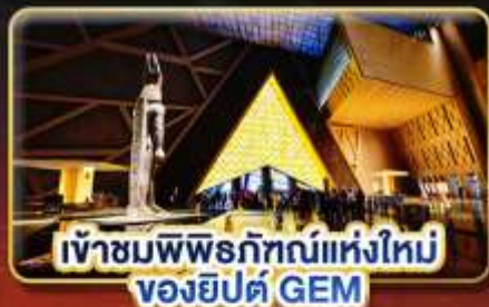
เข้าชมพิพิธภัณฑ์แห่งใหม่ ของอียิปต์ GEM