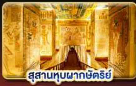
สุสานทูตเนฟคาห์มัตริย์