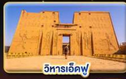
วิหารเอ็ดฟู

น้ำหนักกระเป๋า 23Kg. (เป็นระหว่างประเทศ และบินภายใน)