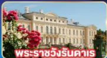
พระราชวังรินคาส