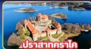
ปราสาทคราโด

พิเศษ! เกี่ยวเกือบครบทุกประเทศยุโรปเหนือ ลิตัวเนีย , ลัตเวีย , เอสโตเนีย , ฟินแลนด์