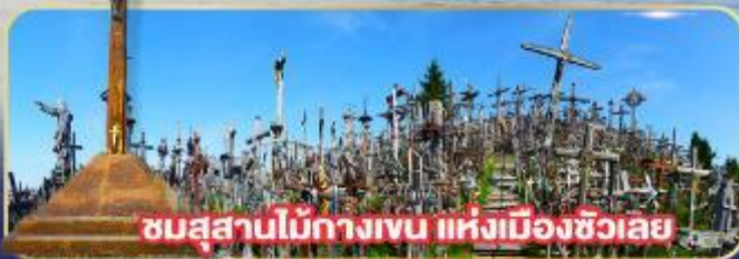
ชมสุสานไม้กางเขน แห่งเมืองฮิวเลย์