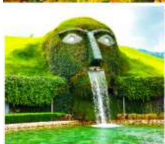
พิพิธภัณฑ์สวารอฟสกี