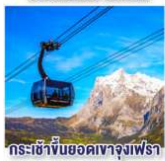
กระเช้าขึ้นยอดเขาจุงเฟรา