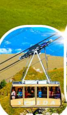
กระเช้าเซเคด้า