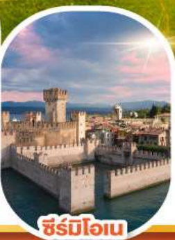
ซิร์มีโอเน