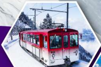
นั่งรถไฟใต้ดินสวิส