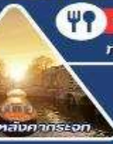
ส่งเรือหลังคากระจก