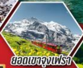
ยอดเขาจุงเฟรา