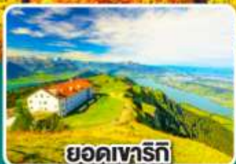
ยอดเขารัทท์