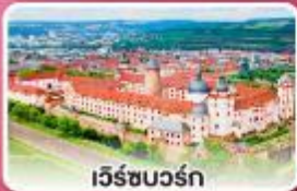
เว็ร์ชบวร์ค