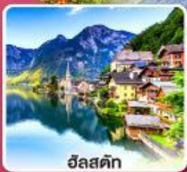
ฮิลส์ติก

เกี่ยวกับครบเส้นทาง สายโรแมนติก เยอรมัน จากเว็ร์ชบวร์คสู่ออกส์บวร์ค