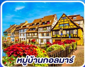
หมู่บ้านกอลมาร์