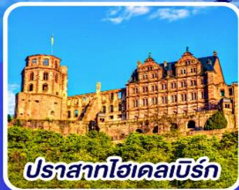
ปราสาทไฮเดลเบิร์ก