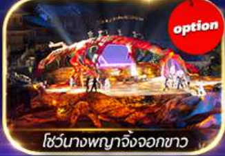
โชว์นางพญาจิ้งจอกขาว