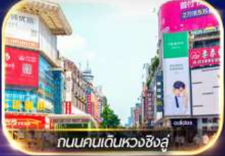
ถนนคนเดินหวงซิงสู

ล่องเรือชมเมืองโบราณ ฟุรงเจิน + ทะเลสาบเป่าเฟิงหู