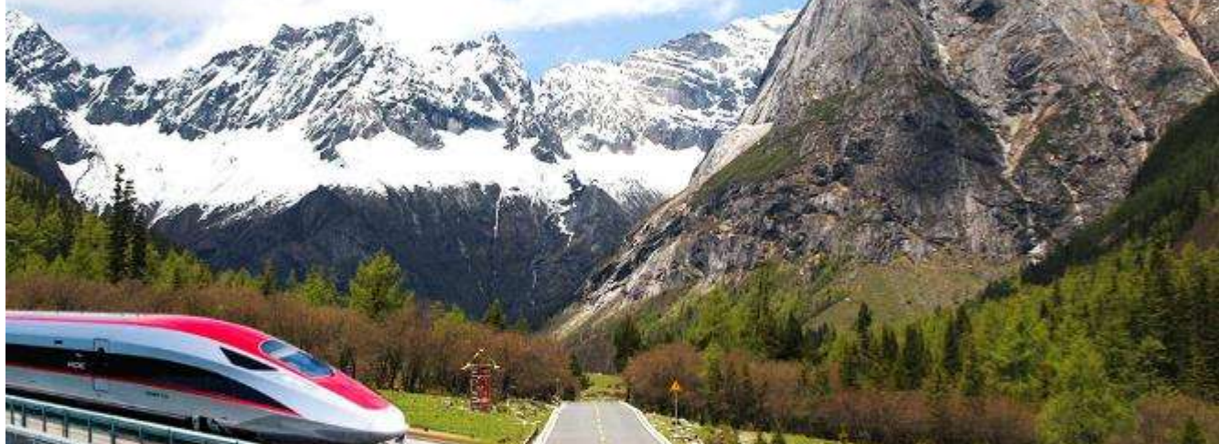
อุทยานจิ่งจ้ายโกว