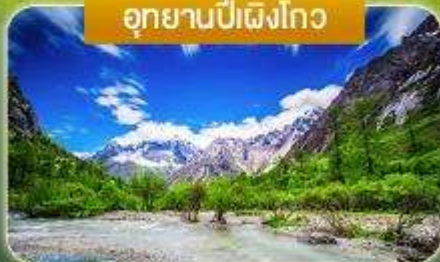
อุทยานป่าเผิงโกว