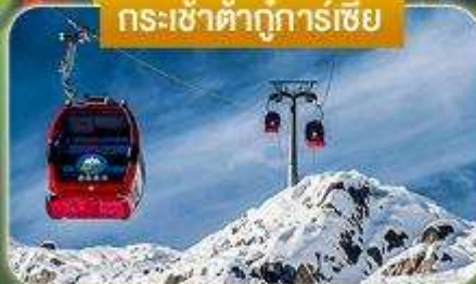
กระเช้าต้ากู่การ์เซีย