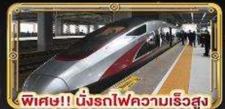
พิเศษ!! นิ่งรถไฟความเร็วสูง