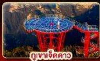
ดูเขาเจ็ดดาว

หมู่บ้านโบราณริมน้ำตก "ฟู่หลงจีน" สัมผัสเสน่ห์จางเจียเจีย มหัศจรรย์ทางธรรมชาติ