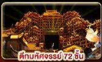
ศึกษาศงจรรยา 72 ชั้น