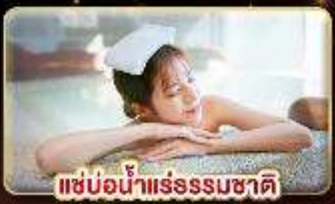
แช่น้ำแร่ธรรมชาติ