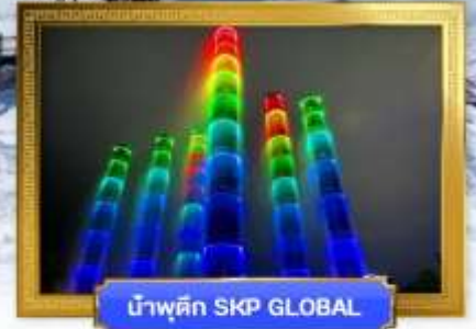
น้ำพุตึก SKP GLOBAL