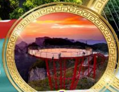
กุเงาเจ็ดดาว