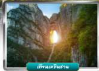
เทียนเหมินชาน