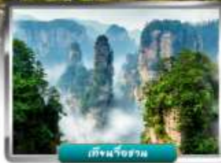
เทียนจื่อชาน

✔ จีนกระช้ายาวที่สุดในโลก สู่ ประตูสวรรค์