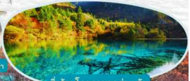
จิวจ้ายโกว รวมรถส่วนตัว