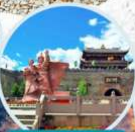
เมืองโบราณซงพาน