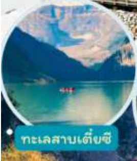
ทะเลสาบเต๋ยซี