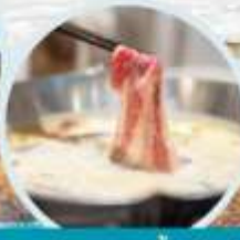
เมนูพิเศษ สุกี้หม่าล่า