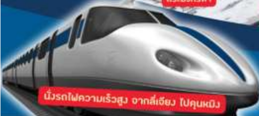
นั่งรถไฟความเร็วสูง จากลี่เจียง ไปคุนหมิง