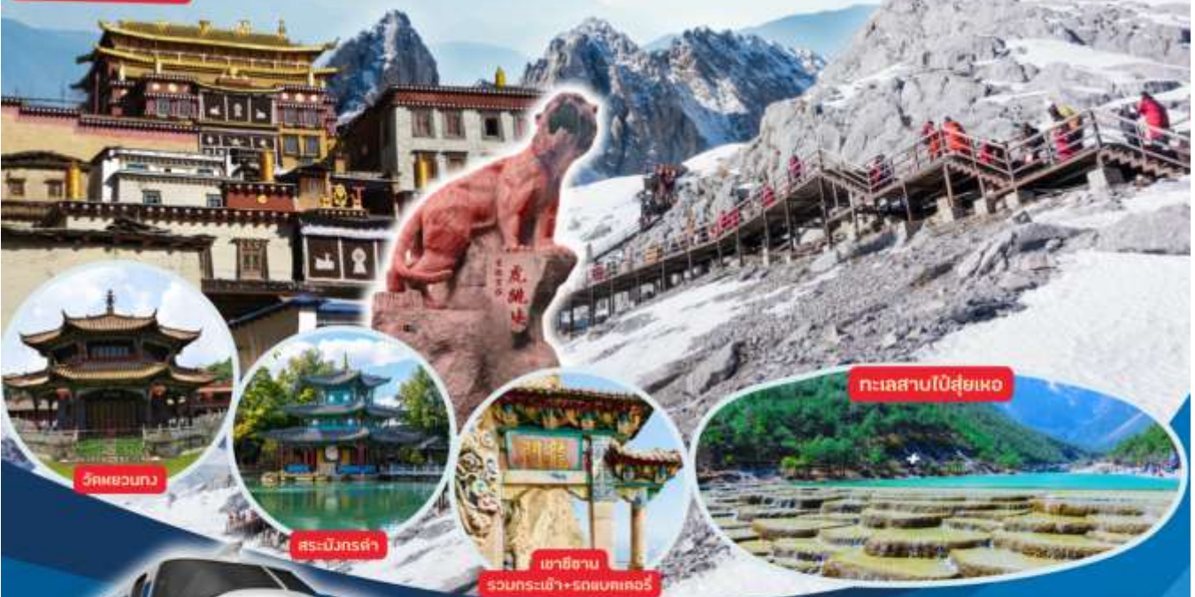
วัดผวยวนกวาง