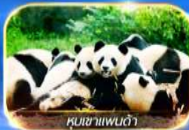
หุบเขาแพนด้า

สัมผัสความงามของธรรมชาติ 2 อุทยาน อุทยานจิวจ้ายโกวและอุทยานน้ำแข็งต้ากู่ นั่งรถไฟความเร็วสูง ชมความน่ารักของน้องหมีที่หุบเขาแพนด้า ซอปปิ้งที่ไท่กู่หลี่ ดูแพนด้ายักษ์ป็นตึก