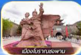
เมืองโบราณชงพาน