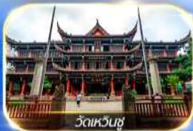
วัดเหวินชู่