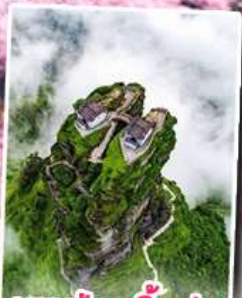
อุทยานกุหลาบพันปี หมู่บ้านแม่วชิเจียง